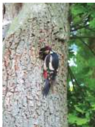
De bonte specht voert haar jongen.

De specht komt veel voor in de Hasseler Es. Een paar jaar geleden trok in juli een windhoos over de Hasseler Es. Een groot aantal bomen waaiden om, of raakten zodanig beschadigd dat ze moesten worden gekapt. Vooral het bosperceel nabij de Jachthut aan het Bartelinkslaantje werd getroffen. Er werd toen een nieuw beleid ingesteld, wat inhield dat van de getroffen bomen de stammen bleven staan. Het idee hierachter was, dat insecten en vogels hiervan konden profiteren. Het hout van de stammen is inmiddels afgestorven en zie: Een spechtenfamilie heeft zijn intrek genomen in een dode stam langs het Bartelinkslaantje. Dankzij dit natuurlijke beleid zijn er de laatste jaren trouwens veel meer spechten in de wijk waargenomen, ondanks dat het zeer schuwe vogels zijn. Met pinda's in een netje kunt u ze lokken. Soms komen de jongen ook mee zoals op de foto rechts.