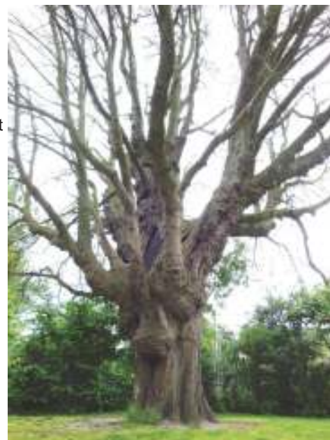
Een kale kastanjeboom tussen het groen. De kastanje lijdt aan de 'bloedingsziekte' die zich over ons land verspreid.

De bekendste boom van de Hasseler Es, de grote kastanje naast Scouting Hasselo, is terminaal ziek. De boom is zwaar aangetast en lijdt aan de 'paardekastanjebloedingsziekte'. Hij is niet meer te redden volgens de bomenexperts die werden geraadpleegd. Alle bomen in de omgeving staan volop in het blad, maar de kastanje, die al vele levensreddende ingrepen heeft ondergaan, is nog praktisch kaal en staat er verpieerd bij. De groei van bladeren en bloesem is plotseling gestopt en komt niet meer op gang. In Nederland werd deze ziekte in 2002 voor het eerst in de Haarlemmermeer ontdekt. Sindsdien heeft de ziekte, die wordt veroorzaakt door de Pseudomonas-bacterie , zich over het hele land verspreid.